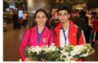
AVRUPA FATİHLERİNE SEVGİ SELİ